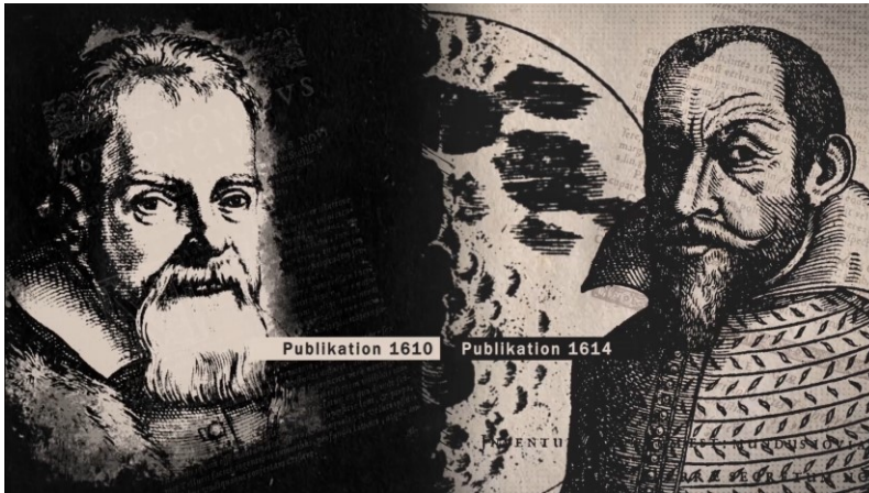
Montage von historischen Abbildungen von Galileo Galilei und Simon Marius.